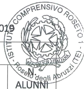
TABELLA MODULI PON PROPOSTE ESPERTI E TUTOR AL 01/04/2019